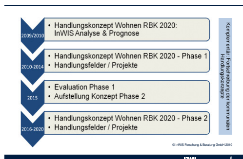
Prozessverlauf auf Kreisebene