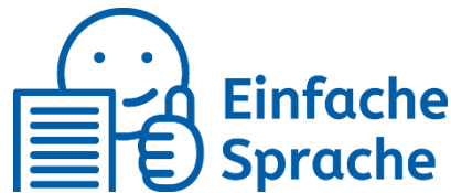
Abbildung 3: Logo einfache Sprache

Um die Texte in einfacher Sprache kenntlich zu machen, kann folgendes Bild verwendet werden: