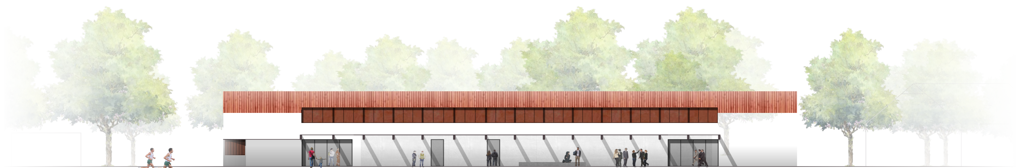
QUERSCHNITT NACH SÜDEN