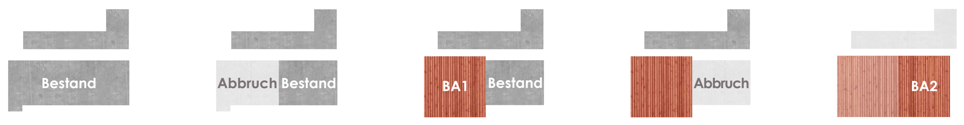
PHASIERUNG / BAUABSCHNITTE + SCHWARZPLAN M1:3000