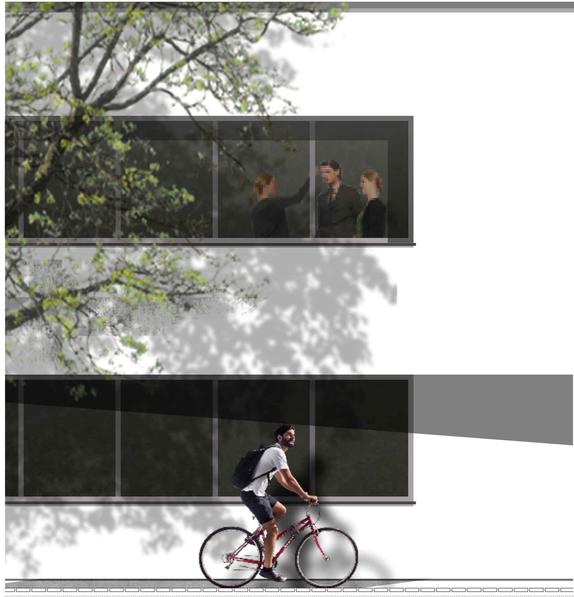
DETAIL M 1:25