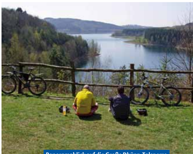
Panoramablick auf die Große Dhünn-Talsperre