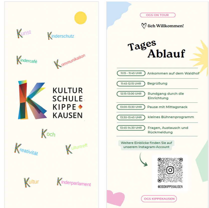
Flyer erstellt von Kindern der SocialMedia-AG