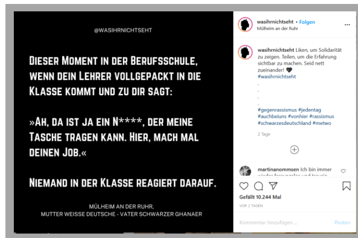
Abb. 2: Instagram-Post (aus: @wasihrichtseht 2020)