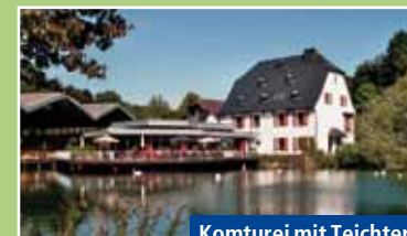
Komturei mit Teichterrasse