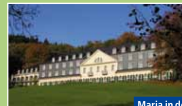
Maria in der Aue