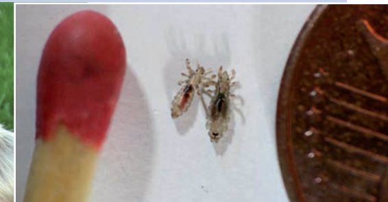
Ausgewachsene Kopflaus (männlich/weiblich) neben Streichholzkopf

Etwa 7 bis 8 Tage nach der Eiablage schlüpft die Larve. Sie durchläuft innerhalb von 9 bis 10 Tagen drei Entwicklungsstadien. 1 bis 2 Tage nach der dritten Häutung sind männliche und weibliche Kopfläuse geschlechtsreif, es entsteht etwa drei Wochen nach der Eiablage eine neue Generation. Ein Männchen lebt circa 15 Tage und ein Weibchen circa 30 bis 35 Tage. In dieser Zeit legt das befruchtete Weibchen täglich bis zu vier Eier, insgesamt etwa 100 Eier.