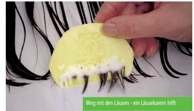
Weg mit den Läusen - ein Läusekamm hilft

Das Laus-Weibchen legt seine Eier oft wie Perlen an der Schnur an den einzelnen Haaren ab. Dabei scheidet es eine Kittsubstanz aus, die für intensive Verklebung mit dem Haar sorgt. Deshalb lassen sich die Nissen nicht durch einfache Kopfwäsche