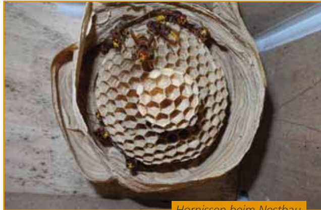
Hornissen beim Nestbau

„Carpe Diem“ heißt es für die Hornissen. Die Königinnen, die am längsten leben und ein Jahr alt werden, leisten in dieser Zeit Unglaubliches. Eine einzelne Königin sucht sich im späten Frühjahr einen geeigneten Niststandort und gründet einen ganzen Staat. Dazu bevorzugt sie dunkle Hohlräume, wie es sie in Bäumen gibt. Als Folge des Mangels an natürlichen Höhlungen finden sich ihre Nester auch auf Dachböden, in Geräteschuppen, Vogelnistkästen und Rollladenkästen. Letzteres ist jedoch ein für Mensch und Tier ungünstiger Standort. Das Besprühen von möglichen Einflugbereichen am Rollladenkasten mit Nelkenöl oder anderen ätherischen Ölen im Frühjahr, kann eine Hornissenkönigin abhalten ihren Staat dort zu gründen.