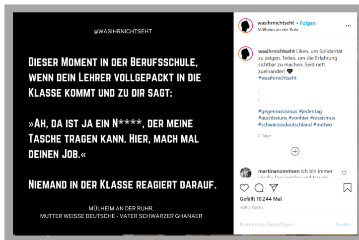
Abb. 2: Instagram-Post (aus: @wasihnichtseht 2020)